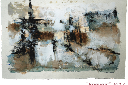
"Snevejr" 2012 20 x 29 cm Akryl på håndgjort papir