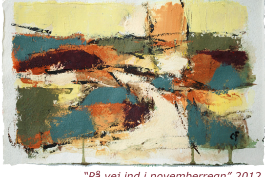
"På vej ind i novemberregn" 2012 20 x 29 cm Akryl på håndgjort papir