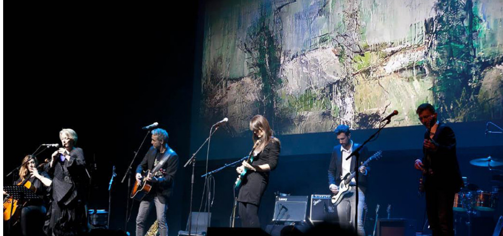
Fra koncerten i Kulturcenter Limfjord, Skive.

Vi er nu igennem efterårets LANDlive koncerter, som blev gennemført med stor succes. Den gode stemning blandt os, der var på turné, forplantede sig ud over scenekanten og gav en fantastisk opbakning og feedback fra publikum. TAK for det - også til Jyske Bank og Arbejdernes Landsbank. Billederne er fra koncerten i Esbjerg, hvor malerierne blev præsenteret for publikum på flotteste vis. Vedhæftet denne mail følger også en super dejlig anmeldelse fra koncerten i Skive. Hvorledes en turné i 2014 kan strikkes sammen er endnu i støbeformen. Men der arbejdes på sagen.