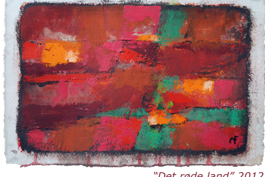
"Det røde land" 2012 20 x 29 cm Akryl på håndgjort papir

Carsten deltager i år med ialt 9 værker - bl.a. disse 3 LAND malerier