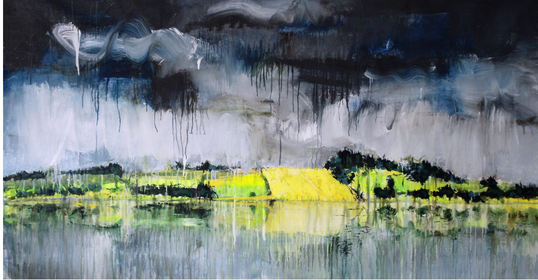
"Sommerregn og solstrejf" 2013 110 x 200 cm Akryl på lærred